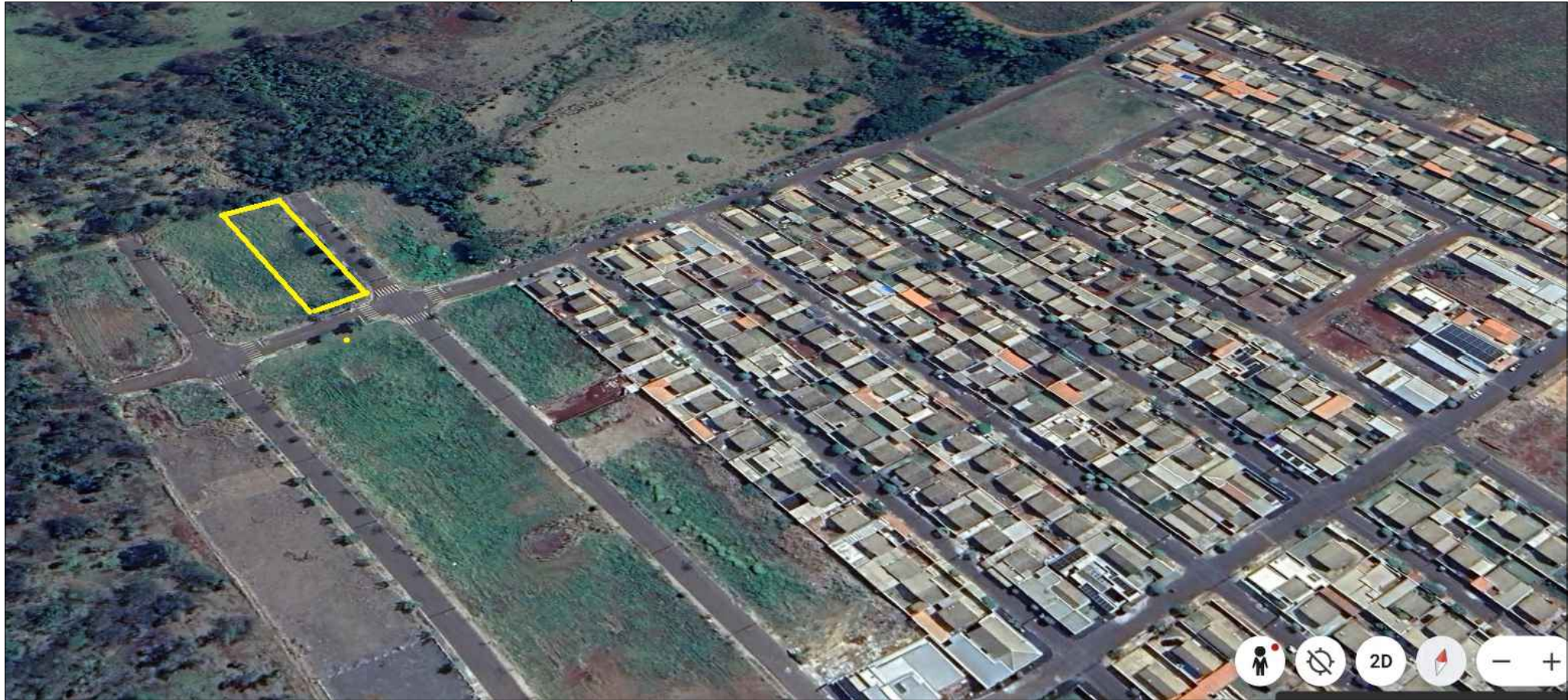
Local da obra - Imagem google SEM ESCALA